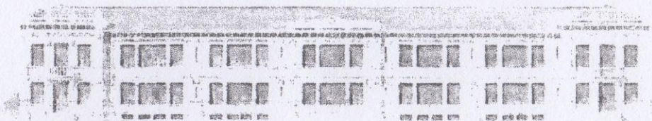
Foto facciata del progetto originario della Scuola Elementare di Marano Vicentino - 15 Dicembre 1922.